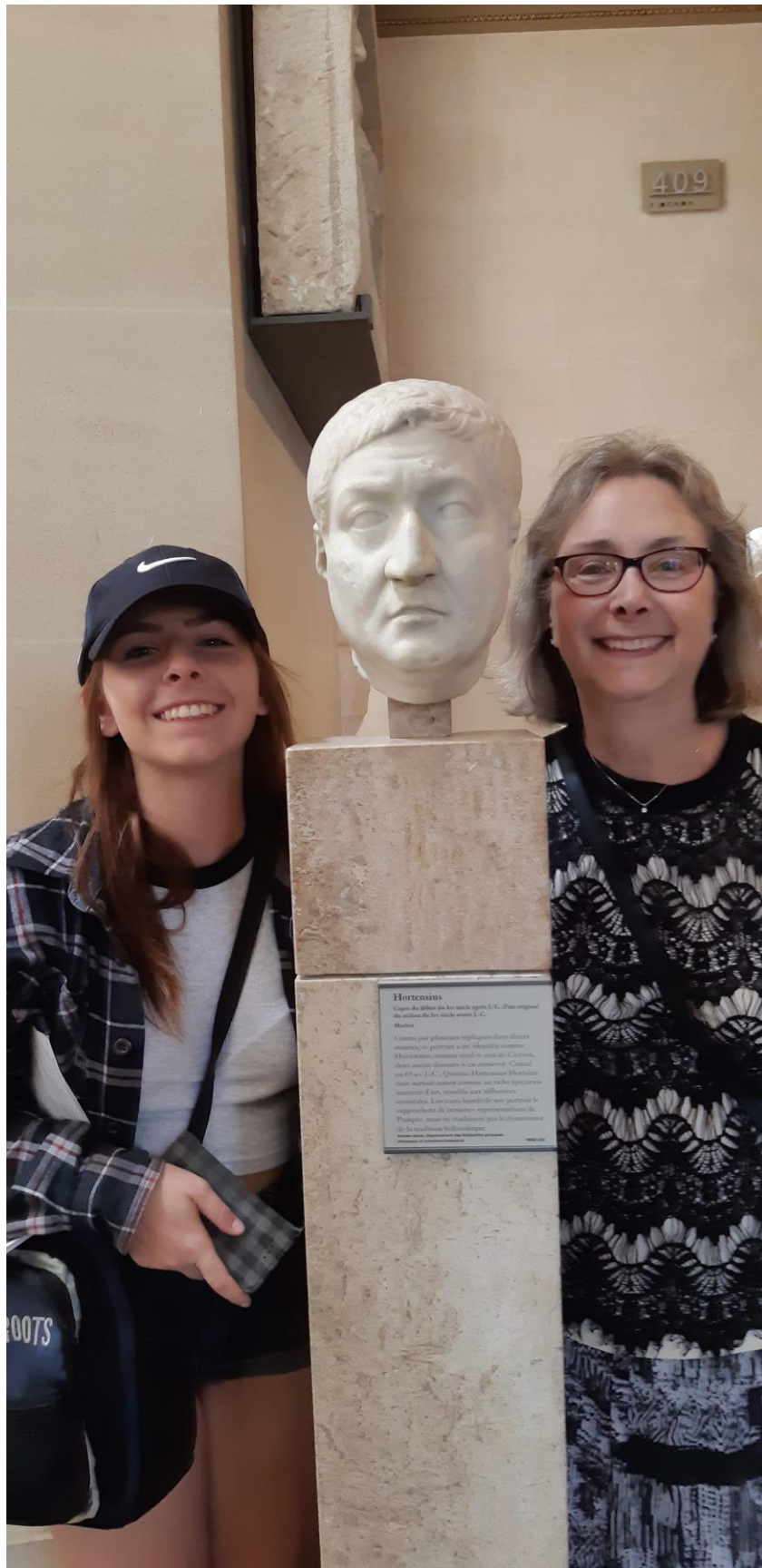
Hortensius Copie du défilé du 1er siècle après J.-C. (Plan original du musée de la ville de Rome J.-C.) Museum C'est un portrait d'homme d'âge mûr, avec des cheveux noirs, un front large et une expression sérieuse. Hortensius, orateur romain et ami de Cicéron, était connu pour sa éloquence et sa personnalité. C'est un 1er siècle J.-C. Quintus Hortensius Hortalus était un orateur romain, un riche propriétaire foncier et un homme d'affaires. Les traits de son visage sont très proches de ceux des représentations de Pompeii, mais on ne sait pas si le défilé est de la tradition hellénistique. Musée de la ville de Rome Musée de la ville de Rome